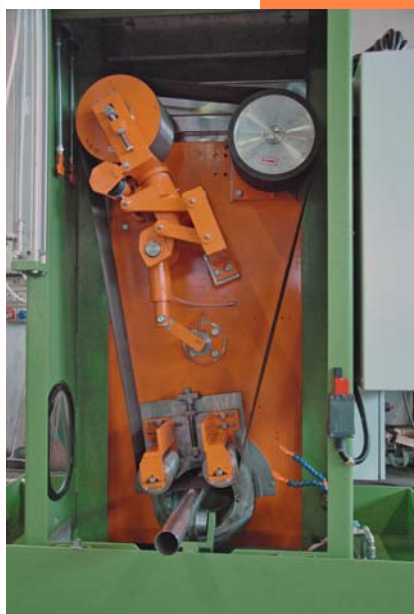
Interno della macchina

Tel.: +39-02-94964141 Fax: +39-02-9466265 e-mail: info@bossi-srl.com http://www.bossi-srl.com