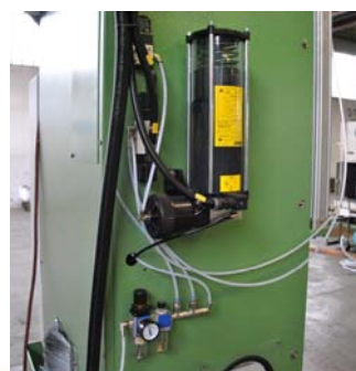
Pompa temporizzata per distribuzione del grasso