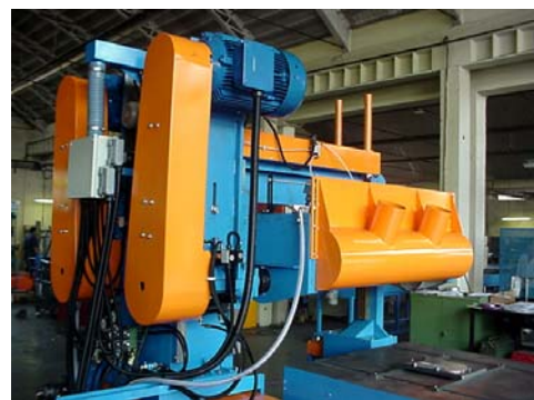
Dettagli del carro porta spazzole