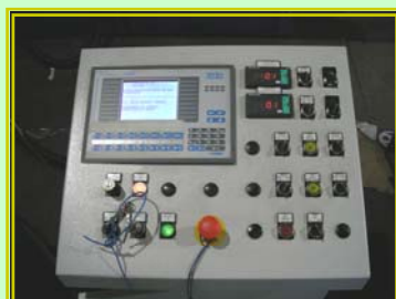
Gestione elettronica tramite PLC

BOSSI S.r.l. - Macchine Finitura Metalli Via Dante 63 20081 ABBIATEGRASSO (MI) - ITALY