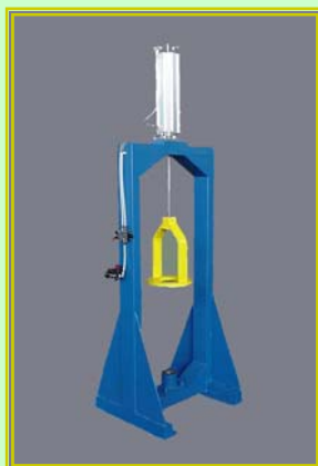
Pressetta per montaggio ruote di pulitura, con comando pneumatico