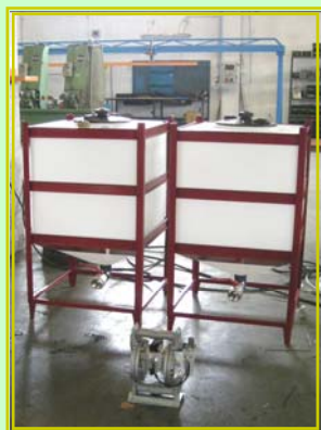
Siletti per pasta abrasiva liquida